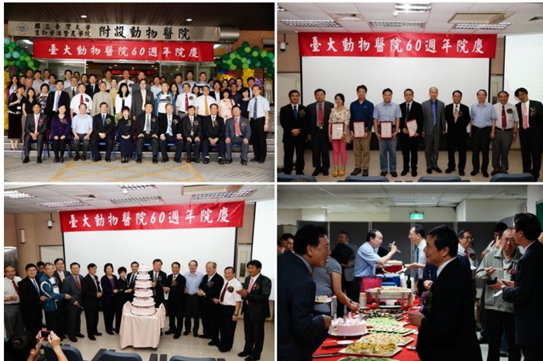
臺大動物醫院 60 周年院慶活動實況

動物醫院除舉辦 60 週年院慶大會外，並舉行專題演講系列活動（期間：4 月 23 日起至 5 月 31 日止，詳細內容請上臺大附設動物醫院網站搜尋 www.vh.ntu.edu.tw ）。