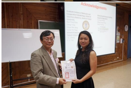
▲周理事長致贈感謝狀予專題演講專家

此外，口頭發表及壁報張貼的參與也十分熱絡。口頭發表共有 30 篇，其中參與競賽者有 18 篇；壁報論文共有 100 篇，參加競賽者有 37 篇。學會邀請各領域專家學者擔任評審委員，