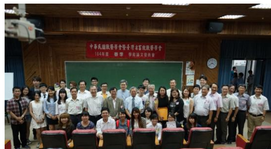
▲與會者於會後合影留念

此外，口頭發表及壁報張貼的參與也十分熱絡。口頭發表共有 30 篇，其中參與競賽者有 18 篇；壁報論文共有 100 篇，參加競賽者有 37 篇。學會邀請各領域專家學者擔任評審委員，