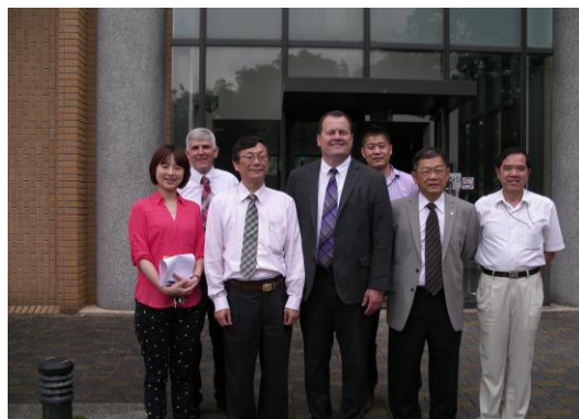
▲於獸三館前合影留念

交流的時光儘管短暫，但對素昧平生的兩校都是一段彌足珍貴的經驗與收穫；期待這次的參訪不會只是單純的參訪，而是攜手合作的開端。