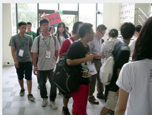
新生家長日參與新生書院的新生

8 月 23 日上午於獸醫三館地下室演講廳，舉辦新生家長日。本屆新生家長日首次與新生書院聯合舉行，共有 41 名新生及 52 位家長出席，參與極為踴躍。