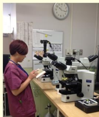
處理室之顯微鏡平台