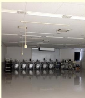
外科與超音波實習教室