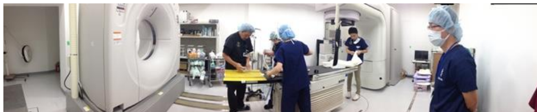
放射線治療室全景(右側為放療機器,左為電腦斷層機器)

整個實習過程，麻布大學國際事務處的工作人員從一開始的接洽與導覽都讓我們感到備受禮遇，對方親自接機帶領我們抵達飯店，所有實習相關的事務都有完整的書面資料與行程表，從起始的歡迎會到歡送會中頒發實習結業證書，可以感受到麻布大學在對待國際學生的重視，相較於臺大動物醫院對待國際學生的方式，我們確實有很大的進步空間。