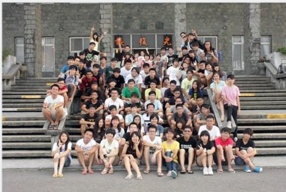
2014 迎新宿營全體成員合影留念

最後一天在 RPG 及戲水之中畫下句點。三天下來，希望無論是系上的新進成員，或是負責活動的同學們，都留下了美好的回憶。