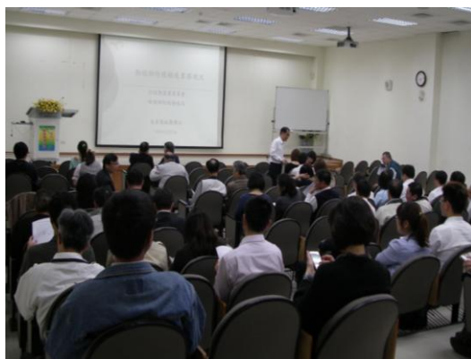
演講會場與會人數眾多