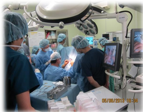
手術室正進行手術狀況