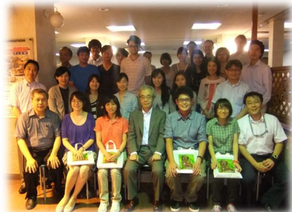
歡送會 第一排中央為麻布大學校長