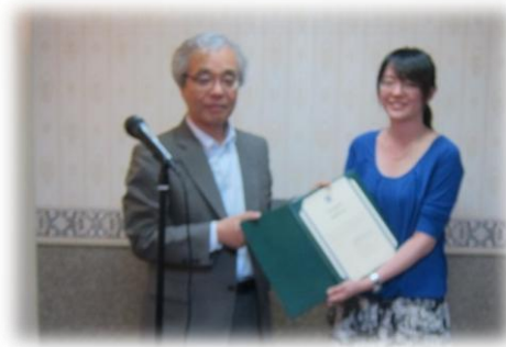
麻布大學校長頒發研習證書