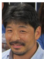
一般外科 茅沼老師