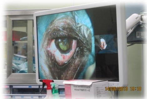
眼科手術及顯微鏡影像播放於大螢幕

六、耗材及藥品皆有專門管理人員，確定數量及庫存。日本法律規定下，藥品及耗材幾乎都為小動物專用，標上動物用的標誌。台灣尚無明確法律規定，但是一些國外進口耗材，常常因為台灣市場較小，沒有進貨。像是專用的經胃餵管，在麻布大學比食道餵管普遍，並且好照顧，對動物刺激小，更容易餵食，而動物恢復狀況也較佳。若在台灣需要使用，則須向國外叫貨，進貨時間長。