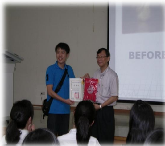
中山女高贈予本院感謝狀