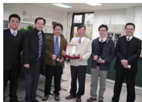
兩院互贈友誼禮物相見歡