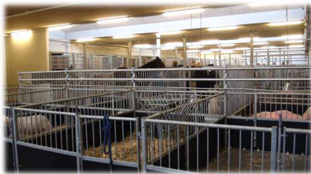
哥大提供各種動物供學生診療實習

即取得獸醫師執照，兩校都非常重視食品衛生，兩所大學的教學醫院主要以小動物（犬及貓）及馬病為主，其他動物則以出診方式訓練學生，兩所大學都有極高意願與國際交流。