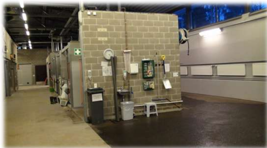
赫大馬病醫院診療區一角