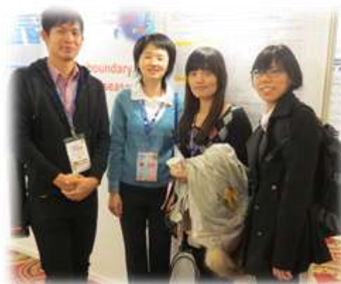
與會比病所學生合影