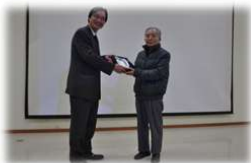
系友會 頒發系友貢獻獎