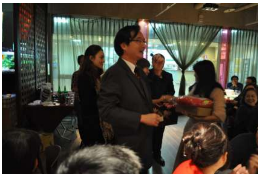
系友會晚宴 抽獎活動