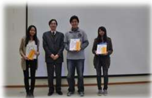
系友會 頒發獎學金