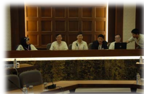
五位院長的主持與報告