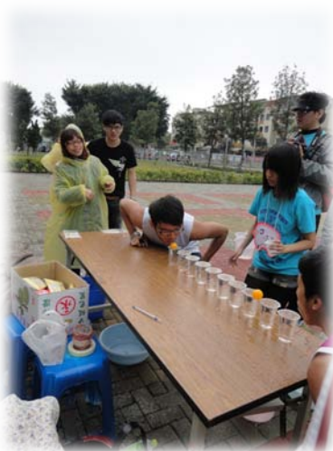
聯誼遊戲—吹乒乓球