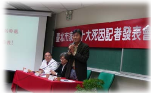
臺北市獸醫師公會楊靜宇理事長回答記者問題