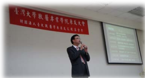
江董事長主持開幕儀式