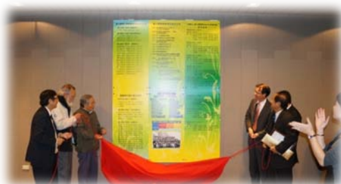
「走過一甲子的臺大獸醫」揭牌儀式