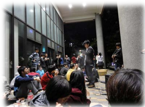
聖誕節前夕，熱情的獸醫系同學們一同在三館前慶祝聖誕