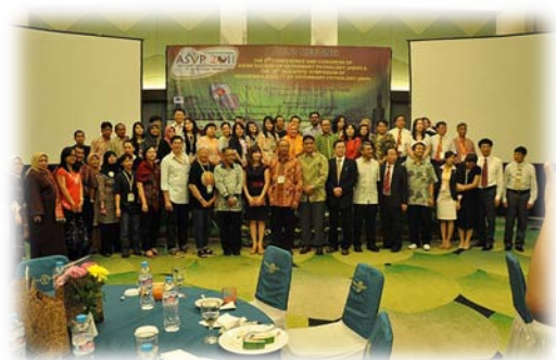
在歡迎晚會上，參與的各國代表大合照