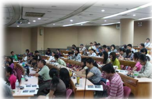
會議現場座無虛席

受其害的委屈與對動物的不平，轉而要求主管機關將寵物管制做好，真正找到那些造成問題的人，也就是「跟狗的關係不是很密切又養了狗的那一群人」—對症下藥，包括畜犬登記與管理、寵物絕育、飼主教育、確實執法，確實教育。