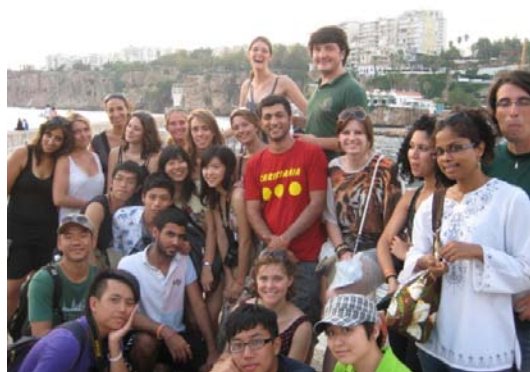
此次活動共有 14 國的獸醫系學生參與