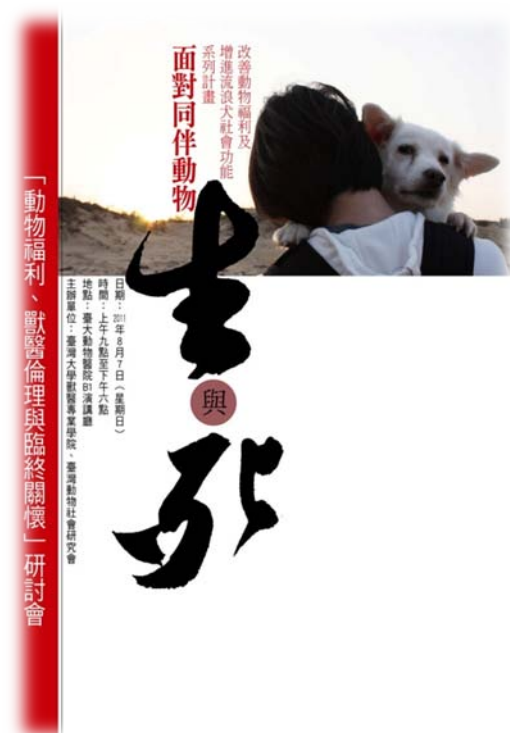
動物福利、獸醫倫理與臨終關懷研討會海報

大多數的流浪動物來自飼主棄養，我們需要好的法律、與好的執行，從源頭堵住棄養，才能解決這個問題。