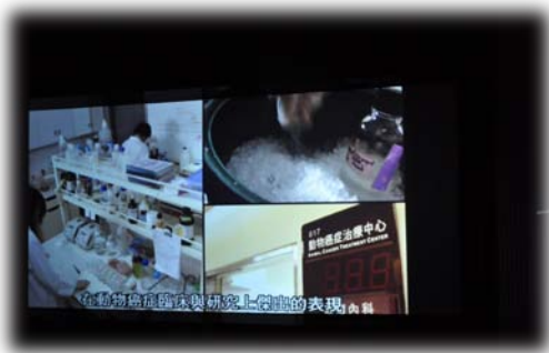
動物醫學面面觀影片發表