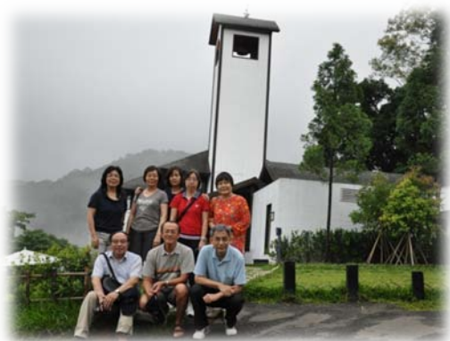
新竹尖石鄉薰衣草森林合影