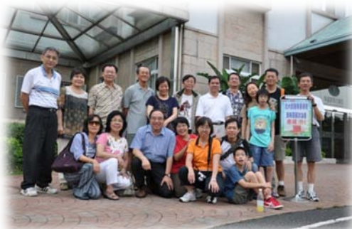
本院老師策略發展座談會議後與眷屬於西湖渡假村大飯店前合影