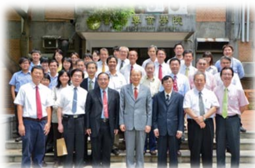
與會嘉賓於獸醫一館前木棧道大合照

7 月 13 日分子暨比較病理生物學研究所假獸醫三館舉行揭牌典禮，本校李嗣涔校長親臨主持，典禮開始播放分子暨比較病理生物學研究所之沿革、現況與未來展望的簡介短片，此次活動有多位貴賓、系友蒞臨一同參與盛會。揭牌儀式結束後，與會嘉賓前往參觀獸醫一館太僕廳，並於獸醫三館前院享用茶點。