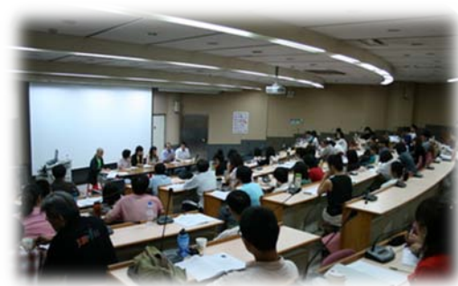
學員們聚精會神的聆聽演講

研討會另邀請師範大學許鈺鵬教授發表「臺灣飼主態度與犬隻行為」研究，及師範大學環境教育研究所王順美教授發表「中小學校園對動物的態度」研究。