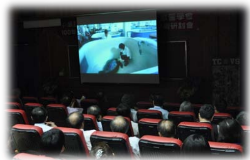
「動物醫學面面觀」下集首播