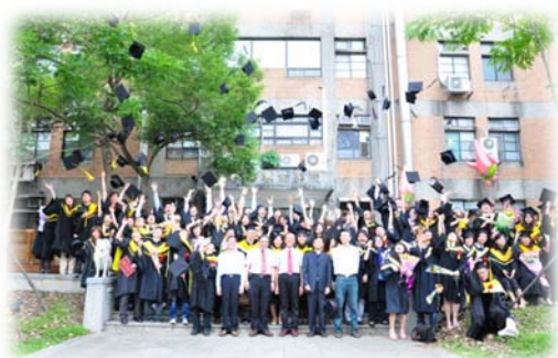
畢業生於獸醫一館前木棧道大合照，畢業生們開心的拋起學士帽