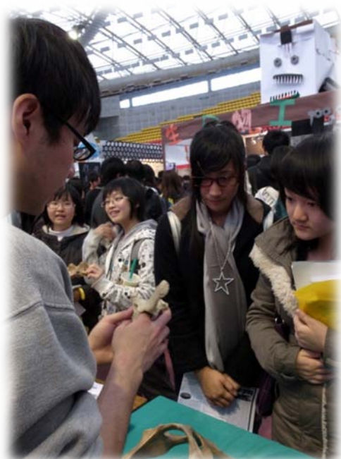
特地前來幫忙的大五學長為高中生解說骨骼學