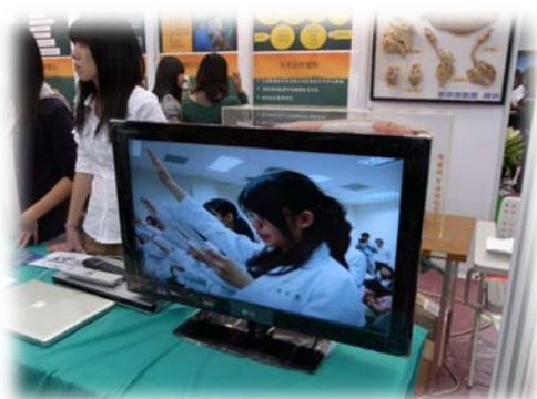
動物醫學面面觀影片展示