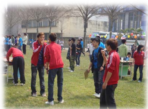
3月5日趣味競賽的盛況