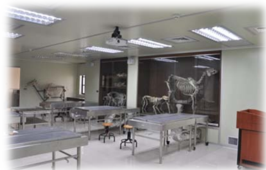
裝修後新穎明亮的解剖教室