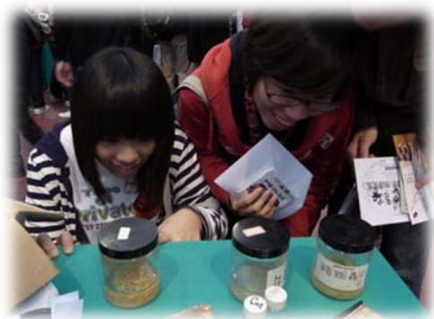
高中生對寄生蟲標本深感興趣

中華民國獸醫學會及臺灣省畜牧獸醫學會拍攝“動物醫學面面觀”宣導影片上集現已放在 YouTube 網站上供民眾瀏覽，相關連結公告於本院網頁 http://www.v.m.ntu.edu.tw/DVM/news/id_117.html ，歡迎大家上網點閱並給予指教。