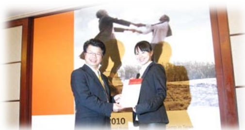
筆者(右)參與 2010 Novartis BioCamp 獲頒證書