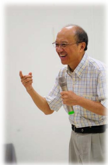
朱瑞民教授妙語如珠的感言分享