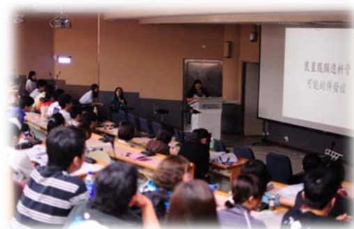
各組同學自製的外科教學影片首映會

自導的教學影片。影片的內容多為外科教學性質，但穿插笑料劇情，讓學長學弟妹們在溫馨哄笑的氣氛中，完成了前後屆交棒的使命，而新一屆的大五同學，隨即將在一週內全面展開為期一年辛苦緊湊但收穫豐碩的診療實習課程。