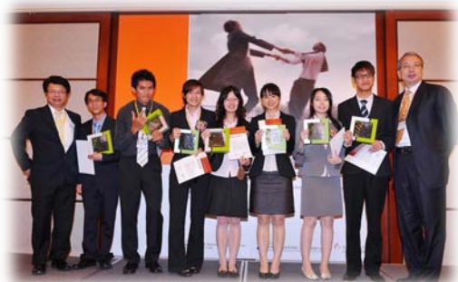
本組在激烈競爭中脫穎而出得到 Best Team 的殊榮，每人獲頒獎座一面。(筆者：右四)