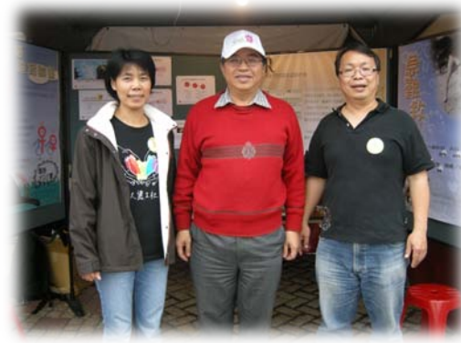
劉院長（中）與專案附設動物醫院獸醫師合照