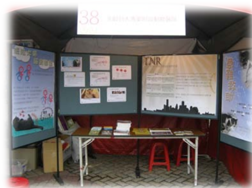
專案附設動物醫院活動攤位佈置