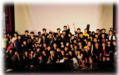
獸醫之夜與會同學大合照

獸醫之夜不只是單純的表演場合，更是一個創造共同美好回憶、共患難情誼的機會，儘管在籌備過程中會遇到許多困難，練習時會遇到瓶頸，但在拉起布幕的那一刻，這就是我們的舞台！