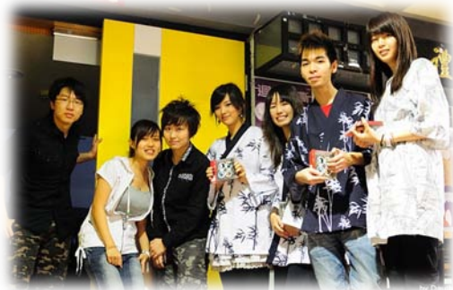
獸醫之夜招待組合影