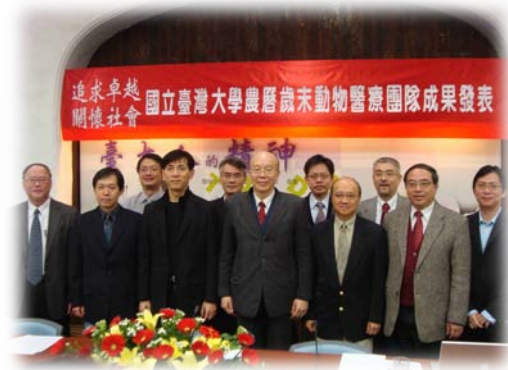
成果發表會後動物癌症醫學中心主要師資陣容與校長、劉院長及其他師長合影