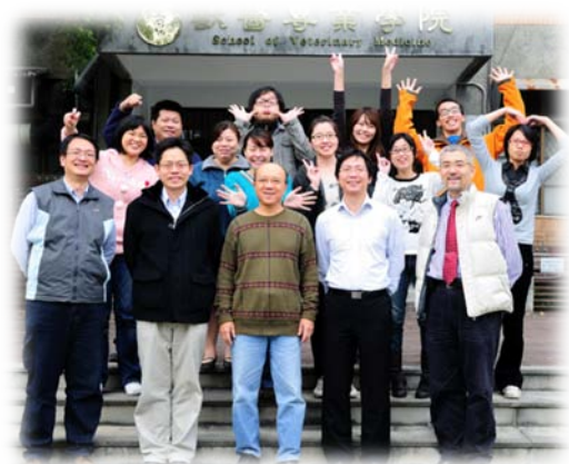
動物癌症醫學研究中心團隊部份研究人員合影