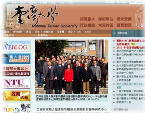
動物癌症醫學研究中心揭牌成為本校網頁首頁標題