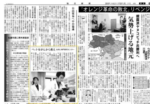
1月25日日本每日新聞刊載本校動物醫療研究情形