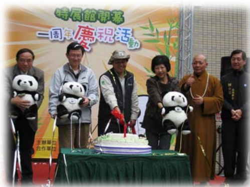
台北市立動物園團圓圓來台一週年與會嘉賓切蛋糕合影