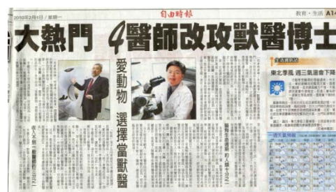
2月1日自由時報刊載本院現為熱門科系