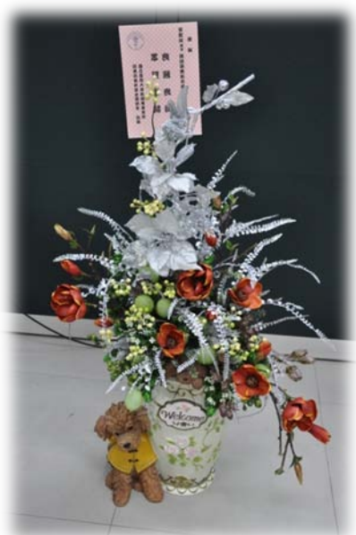
本院致贈侯教授榮任新光吳火獅紀念醫院 院長花禮