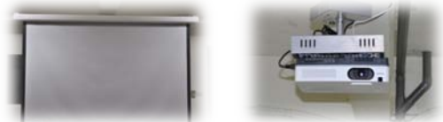
獸醫一館學生活動中心新購置一組液晶 投影機及電動布幕