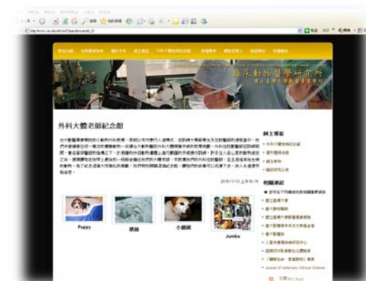
外科大體老師紀念館網頁

外科大體老師紀念館資訊請參閱 http://www.vet.ntu.edu.tw/Clinical/owner/id_2/ 。