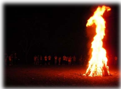
晚會中的營火把夜照得通紅