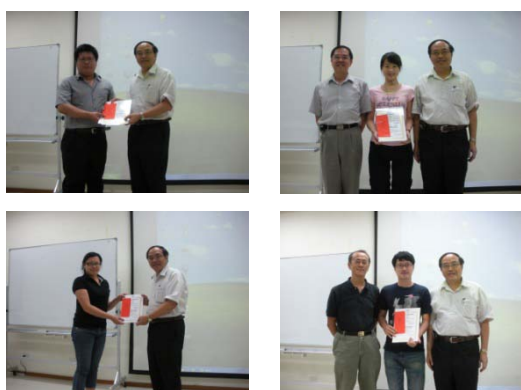
本院 SCI 論文獎頒發情形