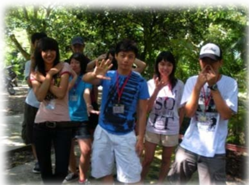
小隊輔及大一新生隊員合影