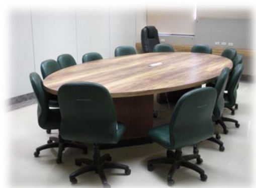
整修後的 305 教室

本院一館 305 研究生討論教室與 412 實習教室，因樓地板、牆壁壁癌，及門、窗等多處毀損，不堪使用，且教室燈光不足，305 教室亦無天花板，412 教室天花板多處毀損，對學生受教權益影響甚鉅，為使師生能有較舒適優良之授課與研討環境，感謝學校及母院生農學院協助，305 室及 412 教室獲得整修。兩間教室均委託張珩建築師事務所設計監造，由皇國室內裝修企業有限公司施作，於 9 月底完工啟用；另獸醫一館公共樓梯間因年久失修，壁癌嚴重，委由坤寶土木包工業，進行壁癌刮除與油漆粉刷施作，亦已完工。目前 305 教室、412 實習教室與一館公共樓梯間都已煥然一新，希望提供師生更好的學習環境，也請大家珍惜使用。