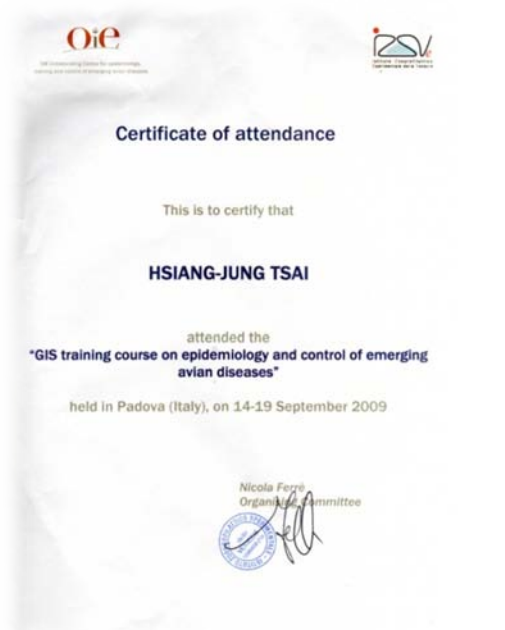
蔡向榮老師參與 GIS 國際訓練課程之結業證書