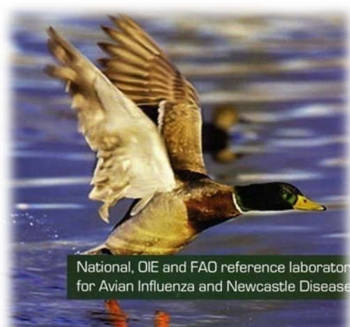
Istituto Zooprofilattico Sperimentale delle Venezie

本國際訓練課程由於電腦演練課程佔了極大比例，因此招收學員名額限定為 20 人，機會十分難得。在五天半的課程中除了 GIS 原理與應用介紹、電腦演練 GIS 的製圖與應用外，也包括了到養雞場現場收集全球定位系統 (GPS; Global Positioning System)數據。蔡向榮教授表示參與此課程收穫良多，希望在返國後能實地應用於流行病學研究中，也歡迎獸醫專業學院其他對 GIS 應用有興趣的老師共同切磋合作相關研究事宜。