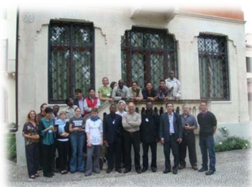
參與本 GIS 國際訓練課程之國際學員與講師合影