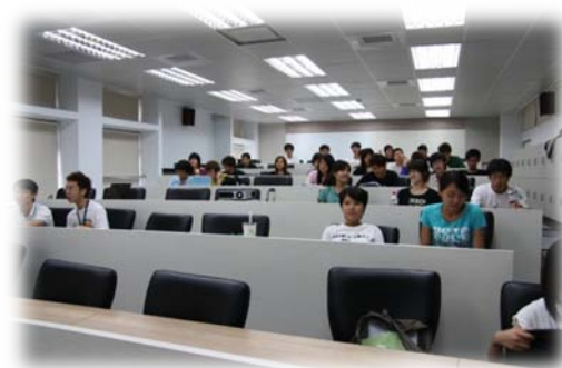
改建為階梯式的 412 教室