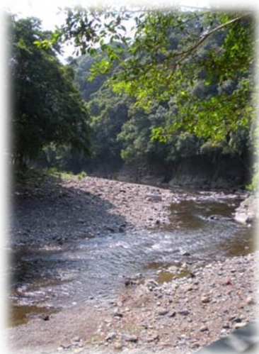
風景優美的青山農場