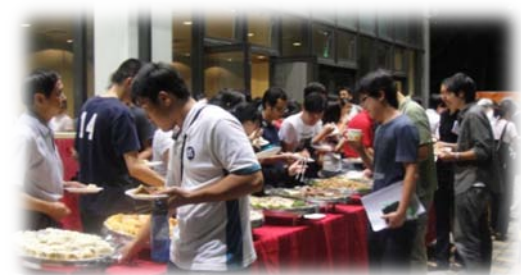
會後於獸醫三館外庭舉辦 buffet，師生一同聚餐