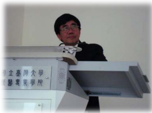
游正博博士親臨演講