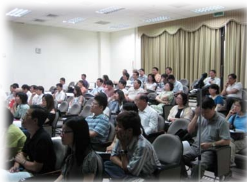
應用靈長類實驗動物研討會，學員們熱情參與