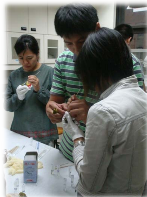
學員分組實際操作寵物鳥捕捉與採樣之情形