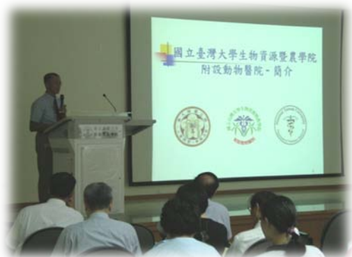
龐院長介紹教學動物醫院